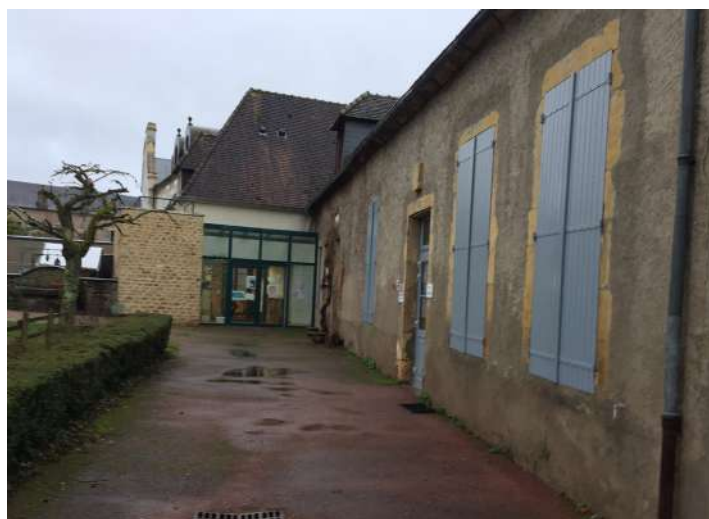
Facade de l'accueil de la petite enfance avant travaux