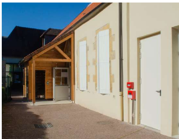
Facade de l'accueil de la petite enfance après travaux