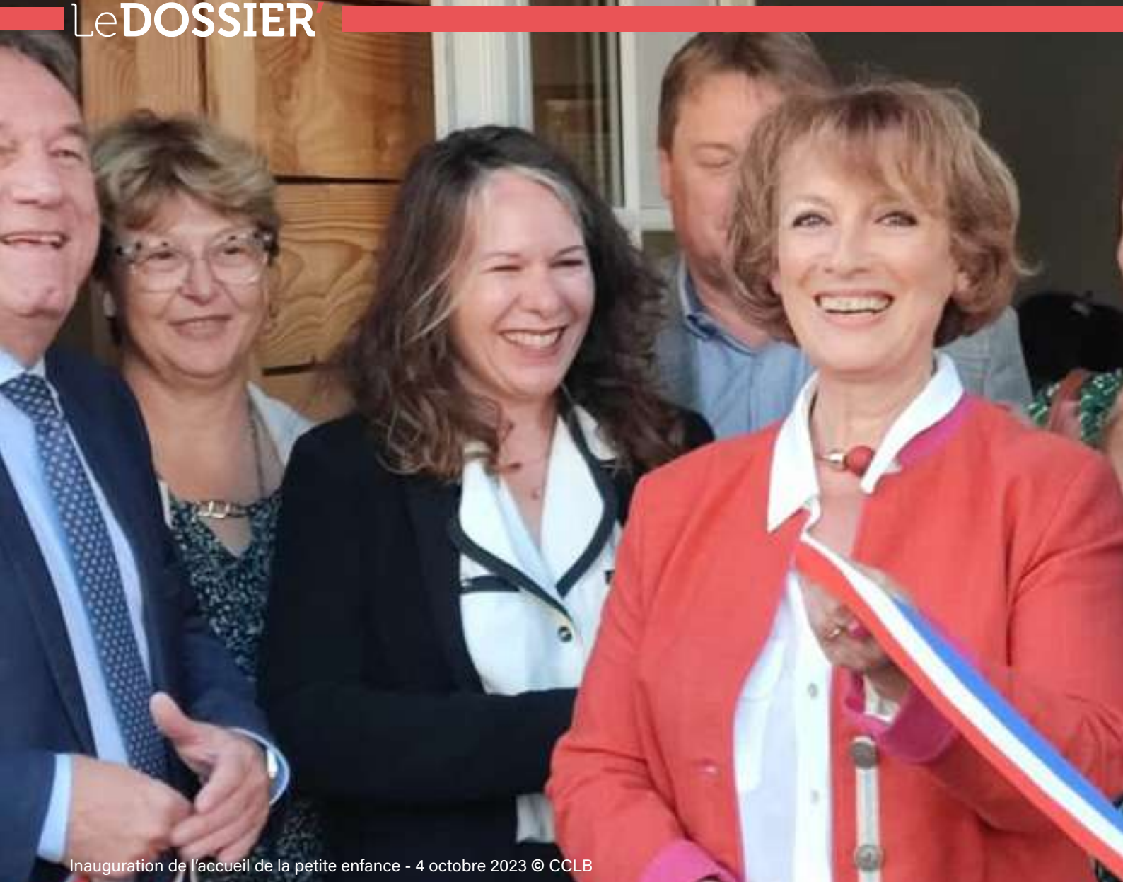
Inauguration de l'accueil de la petite enfance - 4 octobre 2023