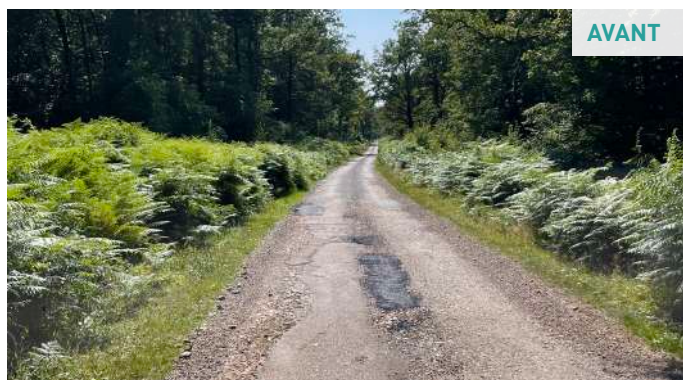
Route forestière à Giry : développement pour la ruralité

Pour 2024, ce sont les communes de Champvoux, Guérigny, Poiseux, La Celle-sur-Nière et Urzy qui verront leurs routes de transport de bois réhabilitées.