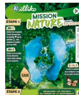
Ticket Mission Nature. En vente dans les 30 000 points de vente de la Française des Jeux.