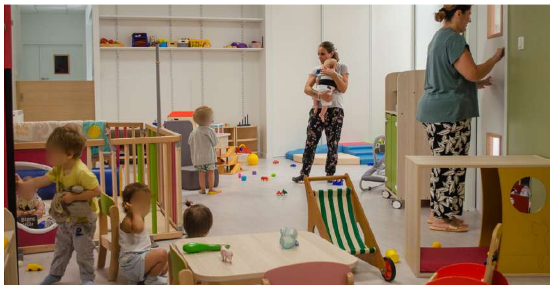
Les enfants prennent leurs marques, quelques jours après l'ouverture