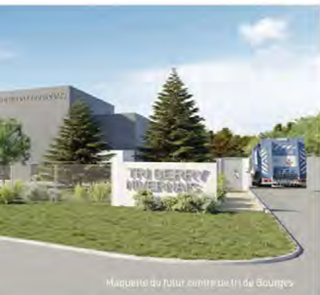
Maquette du futur centre de tri de Bourges